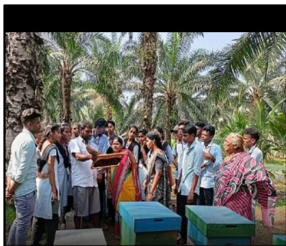
పశ్చిమగోదావరి జిల్లా వార్తలు. వే2న్యూస్.కామ్ way2news way2.co/irmmaug