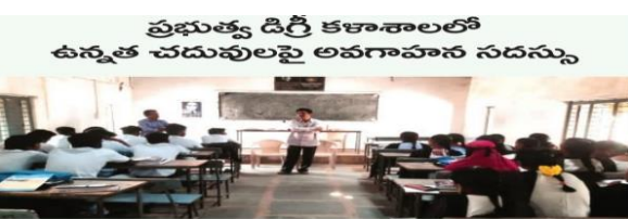
Pallijyothi Paper clipping on 09-03-2023