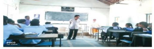
Neti Prabhutvam Paper clipping