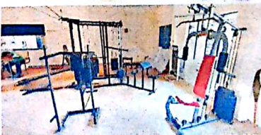
అధునిక పరికరాలతో కళాశాల వ్యాయామశాల

విద్యార్థులు వివిధ క్రీడా పోటీల్లో పాల్గొని విశ్వ విద్యాలయం, సోల్ జోన్ స్థాయిలో పతకాలు సాధించి కళాశాల కీర్తి ప్రతిష్ఠలను నిలబెడుతున్నారు. యోగ విద్యకు ఇక్కడ సముచిత స్థానం ఉంది. గడచిన ఏడాది కాలంలో వివిధ క్రీడలు, అథ్లెటిక్స్ లో 25కు పైగా పతకాలు సాధించారు.