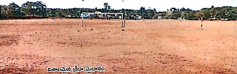
విశాలమైన క్రీడా మైదానం