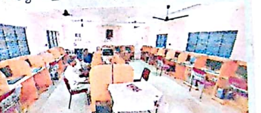
జవహర్ విజ్ఞాన కేంద్రం

బీఎస్సీ సీబీఇడ్ విభాగాన్ని ఇక్కడ మూడేళ్ల కిందట ప్రారంభించారు. ఈ విభాగానికి వివేకతమైన దిమాండ్ ఉంది. ఉన్న 40 సీట్లు చాలక ఏటా విశ్వవిద్యాలయం నుంచి ప్రత్యేక అనుమతితో అదనంగా విద్యార్థులను చేర్చుకుంటున్నారు. తరగతి గదుల కొరత కారణంగా రెండ్ సెక్షన్ ప్రారంభించే సాహసం చేయలేకపోతున్నారు. దాదాపు పది తరగతి గదుల కొరత ఉంది. ఈ ఏడాది నుంచి సీఎస్టీఎస్ డిగ్రీ కళాశాలలో ఎన్ఎస్ఐ ప్రారంభించనున్నారు. రెండు ఎన్ఎస్ఐస్ యూనిట్లు ఉన్నాయి. జవహర్ విజ్ఞాన కేంద్రం ద్వారా ప్రత్యేకంగా కంప్యూటర్ పై కోర్సులు ఉన్నాయి.